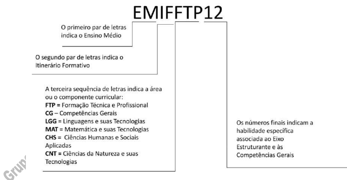
Gráfico explicativo do Código de Habilidade da Formação Técnica Profissional – FTP

A distribuição das habilidades indicadas acima ocorre em conformidade com a correlação entre estas habilidades e as atribuições empreendedoras, apresentada nos Componentes Curriculares em que as atribuições correlatas forem alocadas, cumprindo, dessa forma, a função prevista pelos Eixos Estruturantes.